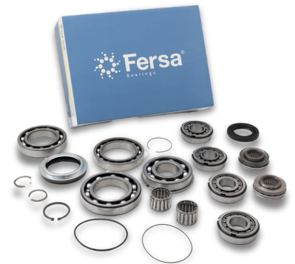
FTRK ENDURANT EE HD*